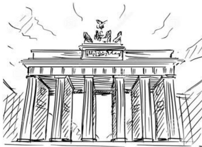
NIEMIECKI NA DWÓCH POZIOMACH ZAAWANSOWANIA