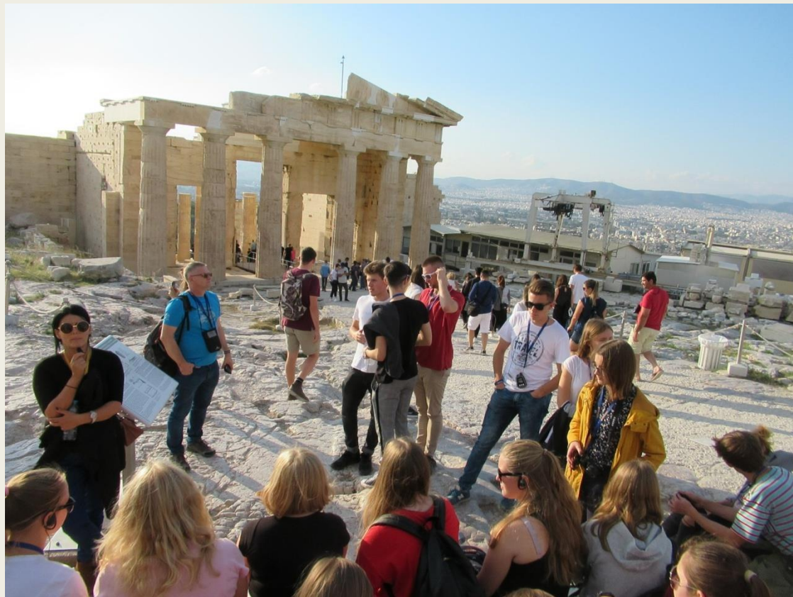
uczestnicy wyjazdu podczas zwiedzania zabytków Hellady