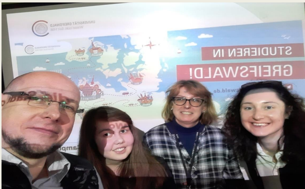
uczniowie klas 1e i 2e na spotkaniu zorganizowanym przez Uniwersytet w Greifswaldzie oraz nauczyciele Dąbrówki i przedstawicielki uczelni