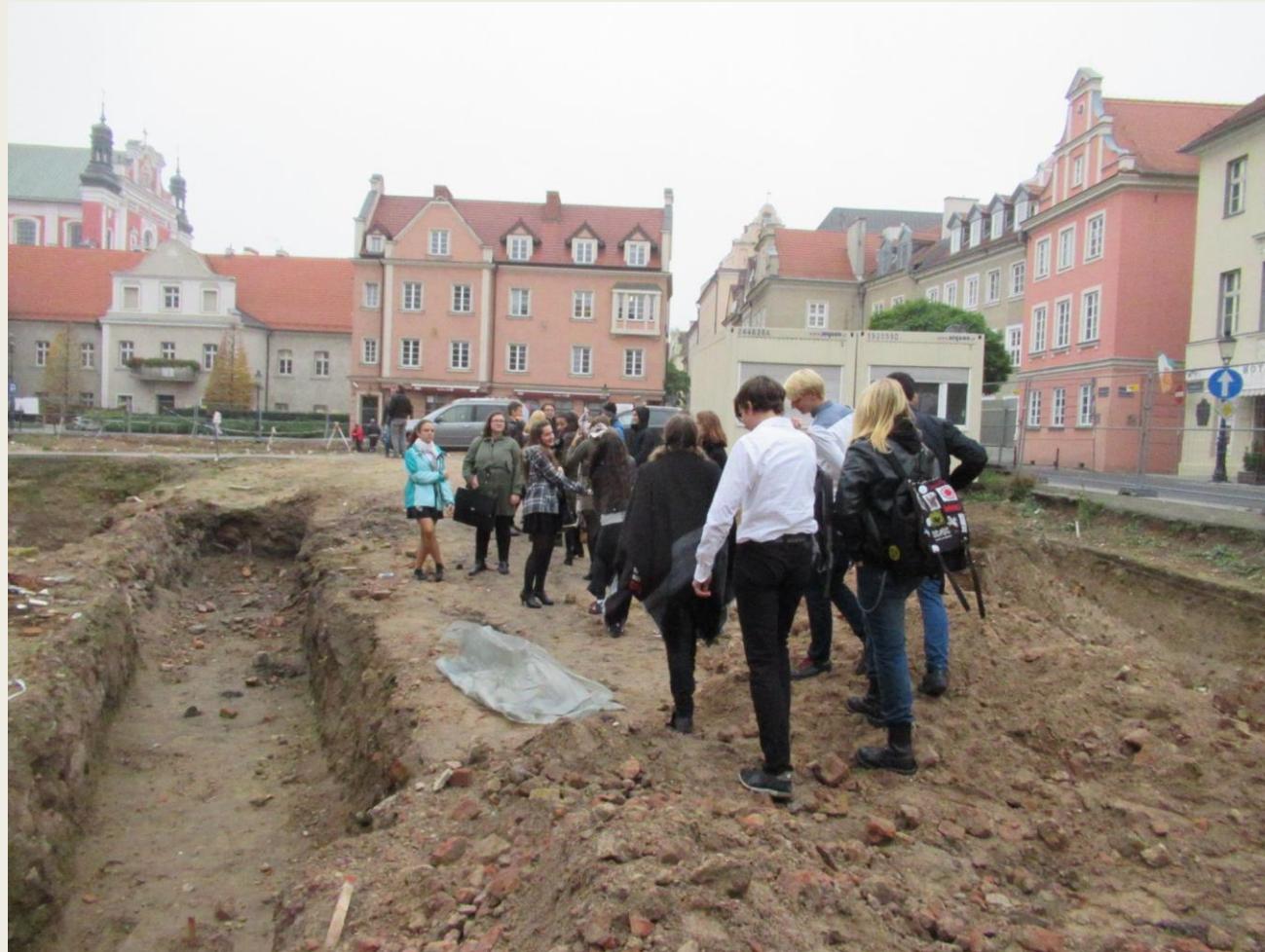
zwiedzanie wykopalisk na Placu Kolegiackim, spotkanie z archeologiem