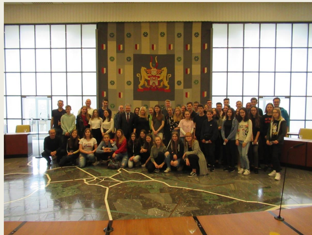
uczestnicy wymiany podczas realizacji niemieckiej i polskiej części programu