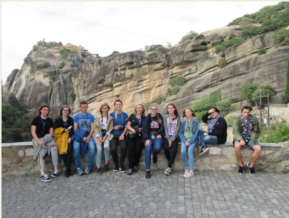
uczestnicy wyjazdu podczas zwiedzania zabytków Hellady