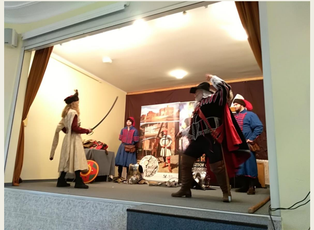
Teatr Historyczny "Chorągiew Komturstwa Gniewskiego"