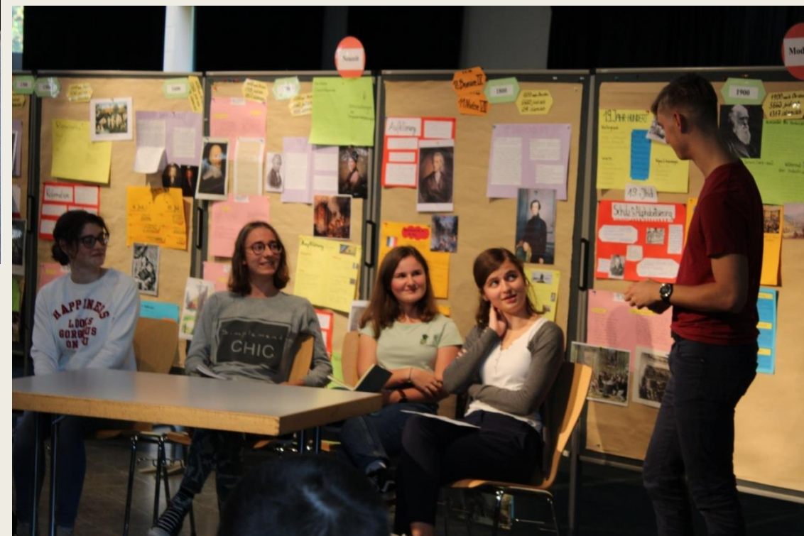
uczestnicy projektu SchulBrücke – X.2019 (z Polski przedstawiciele/-ki klasy 1e)