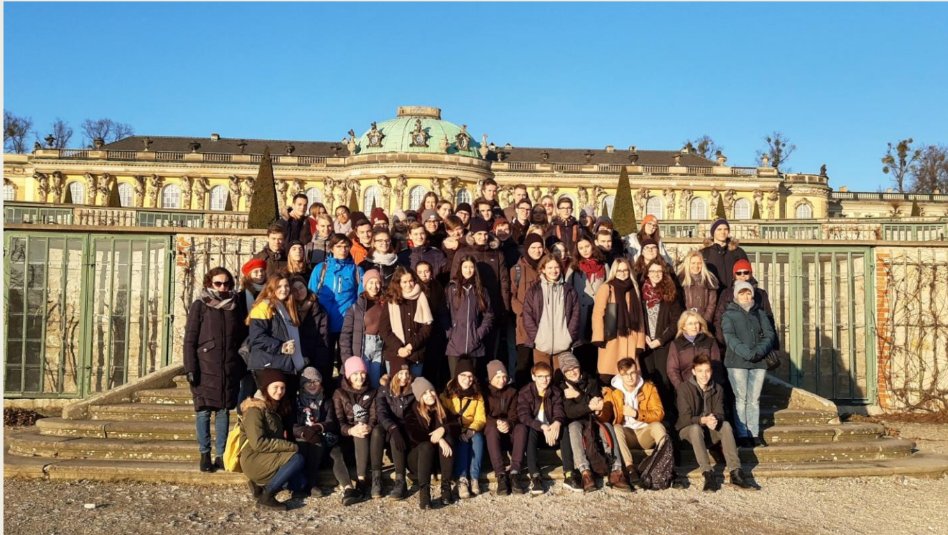
klasa wstępna oraz klasy 1e i 2e na wycieczkach w Poczdamie – XII. 2019