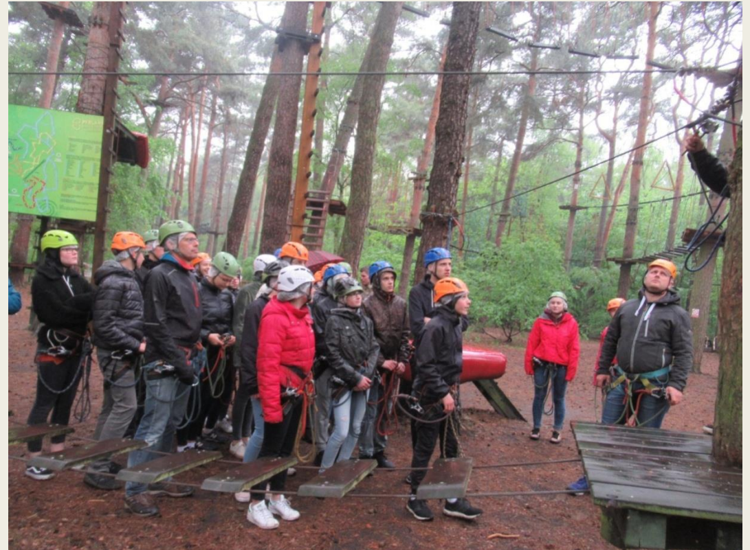
uczestnicy wymiany podczas realizacji niemieckiej i polskiej części programu