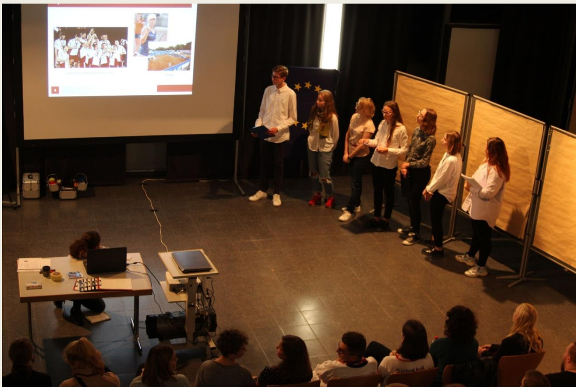
uczestnicy projektu SchulBrücke – X.2019 (z Polski przedstawiciele/-ki klasy 1e)