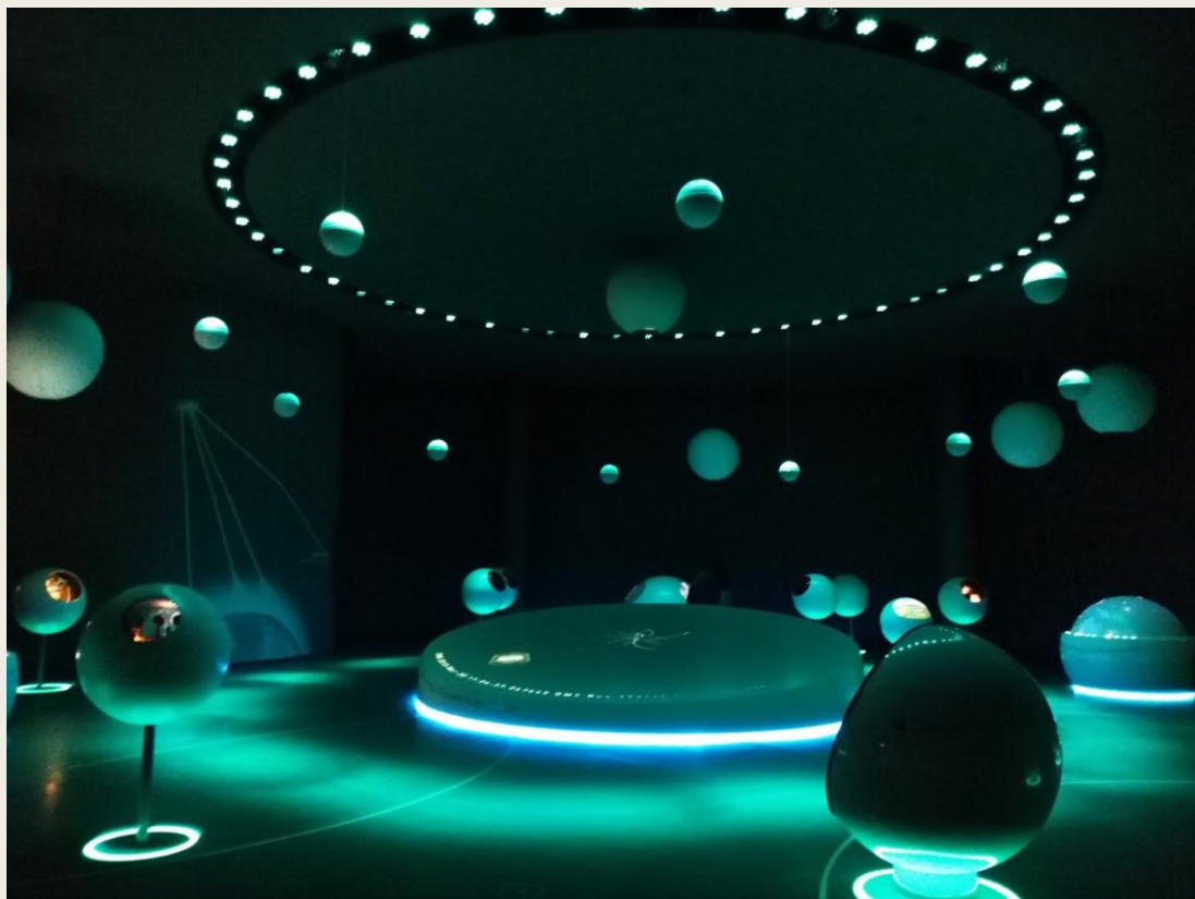
wizyta w Europejskiej Organizacji Badań Jądrowych CERN w Szwajcarii – rok 2018