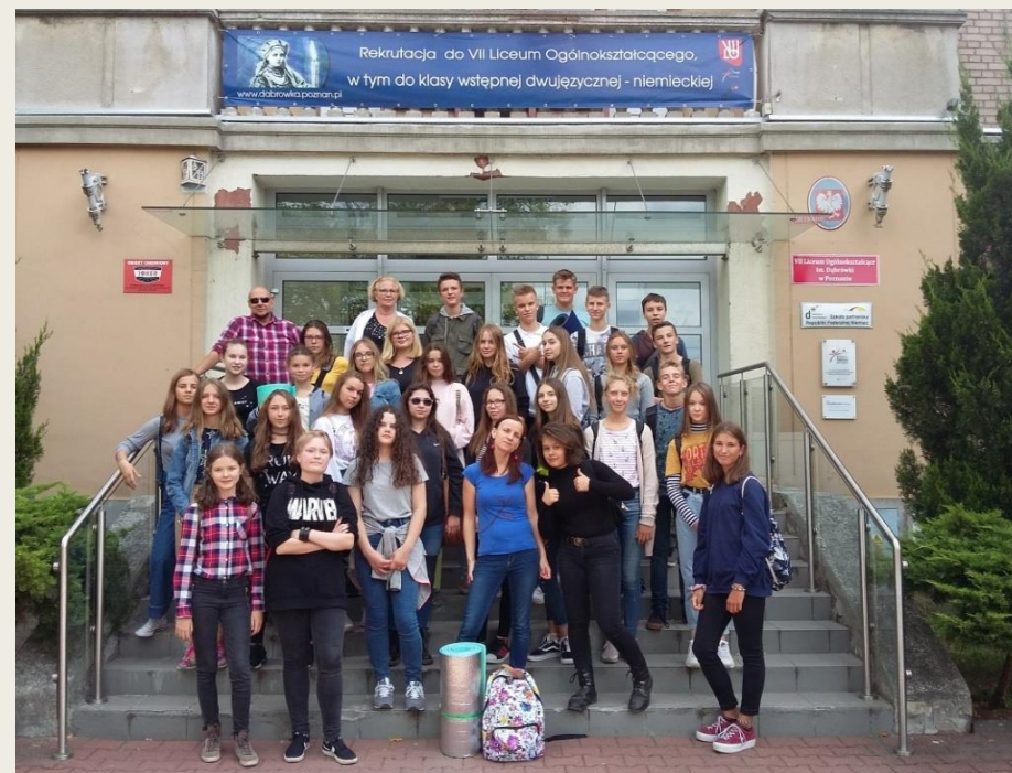
wyjście integracyjne klasy wstępnej – IX.2019