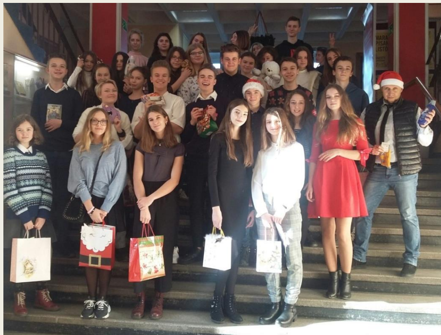
wigilia klasowa klasy wstępnej – XII.2019