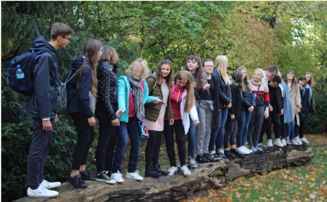
uczestnicy projektu SchulBrücke – X.2019 (z Polski przedstawiciele/-ki klasy 1e)